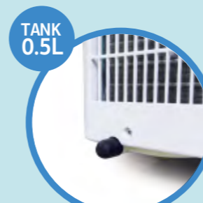
Drain valve (tube not included)