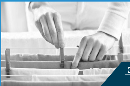
ΣΤΕΓΝΩΜΑ ΡΟΥΧΩΝ LAUNDRY DRYING