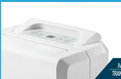
ΛΑΒΗ ΜΕΤΑΦΟΡΑΣ TRANSPORTING HANDLE