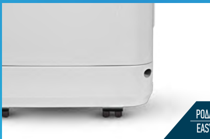
ΡΟΔΑΚΙΑ ΜΕΤΑΚΙΝΗΣΗΣ EASY MOVING WHEELS