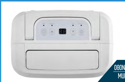
ΘΕΩΝΗ ΠΟΛ. ΛΕΙΤΟΥΡΓΙΩΝ MULTIFUNCT. DISPLAY