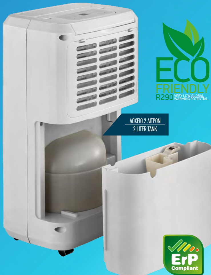
ΔΟΧΕΙΟ 2 ΛΙΤΡΩΝ 2 LITER TANK