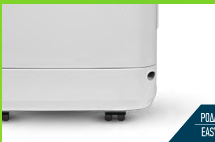
ΡΟΔΑΚΙΑ ΜΕΤΑΚΙΝΗΣΗΣ EASY MOVING WHEELS