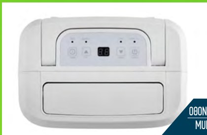
ΘΕΩΝΗ ΠΟΛ. ΛΕΙΤΟΥΡΓΙΩΝ MULTIFUNCT. DISPLAY