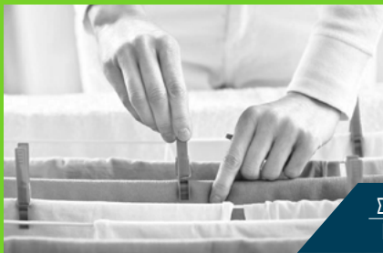
ΣΤΕΓΝΩΜΑ ΡΟΥΧΩΝ LAUNDRY DRYING