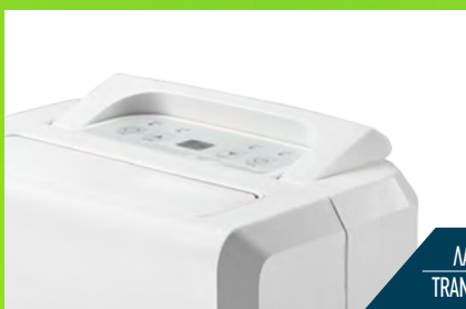
ΛΑΒΗ ΜΕΤΑΦΟΡΑΣ TRANSPORTING HANDLE